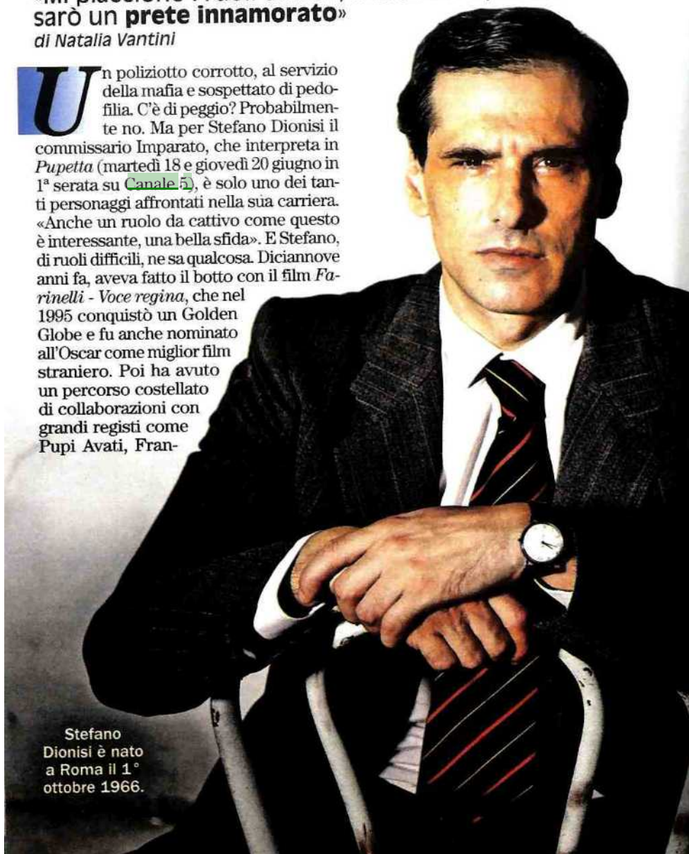
Stefano Dionisi è nato a Roma il 1° ottobre 1966.

U n poliziotto corrotto, al servizio della mafia e sospettato di pedofilia. C'è di peggio? Probabilmente no. Ma per Stefano Dionisi il commissario Imparato, che interpreta in Pupetta (martedì 18 e giovedì 20 giugno in 1ª serata su Canale 5 ), è solo uno dei tanti personaggi affrontati nella sua carriera. «Anche un ruolo da cattivo come questo è interessante, una bella sfida». E Stefano, di ruoli difficili, ne sa qualcosa. Diciannove anni fa, aveva fatto il botto con il film Farinelli - Voce regina , che nel 1995 conquistò un Golden Globe e fu anche nominato all'Oscar come miglior film straniero. Poi ha avuto un percorso costellato di collaborazioni con grandi registi come Pupi Avati, Fran-